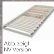
Abb. zeigt NV-Version