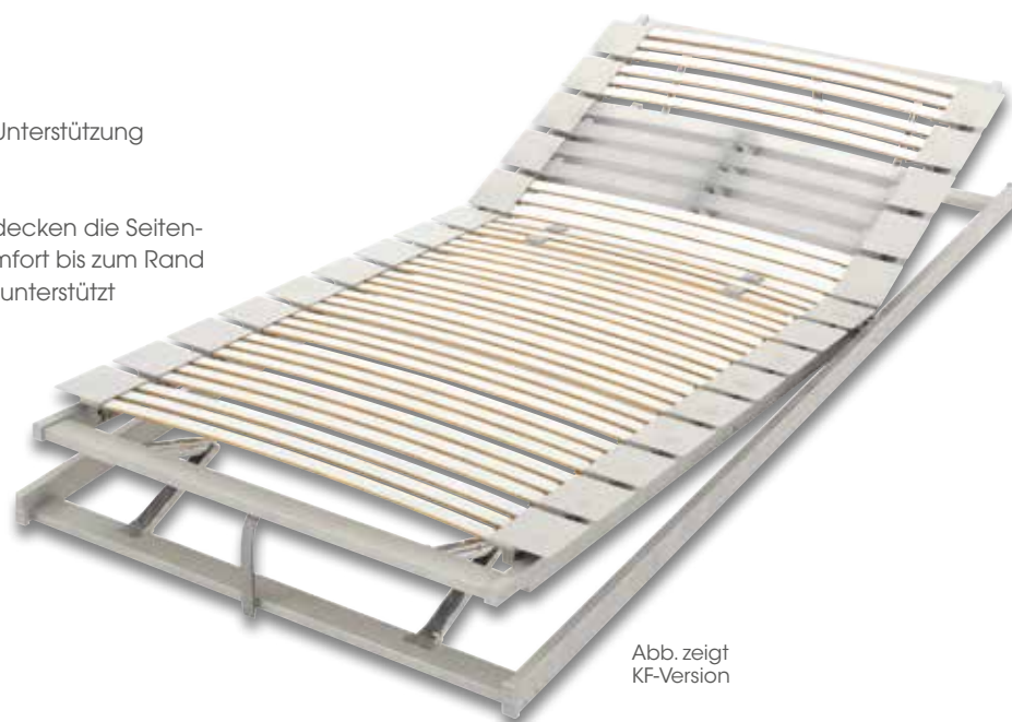
Abb. zeigt KF-Version