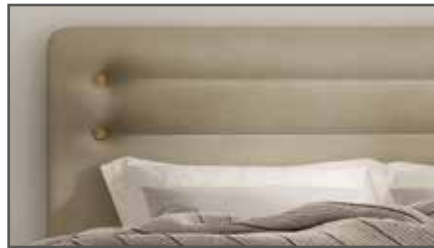
Fidelio (Knöpfe in Eiche oder Nussbaum)