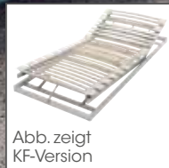
Abb. zeigt KF-Version